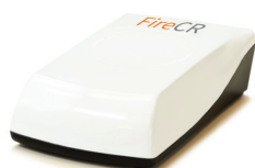
Kompaktowy czytnik FireID RFID